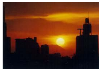
日暮里富士見坂 (現在は見えません)