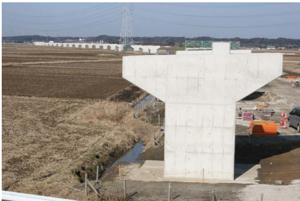
(仮称)東IC～千葉県境の工事状況写真