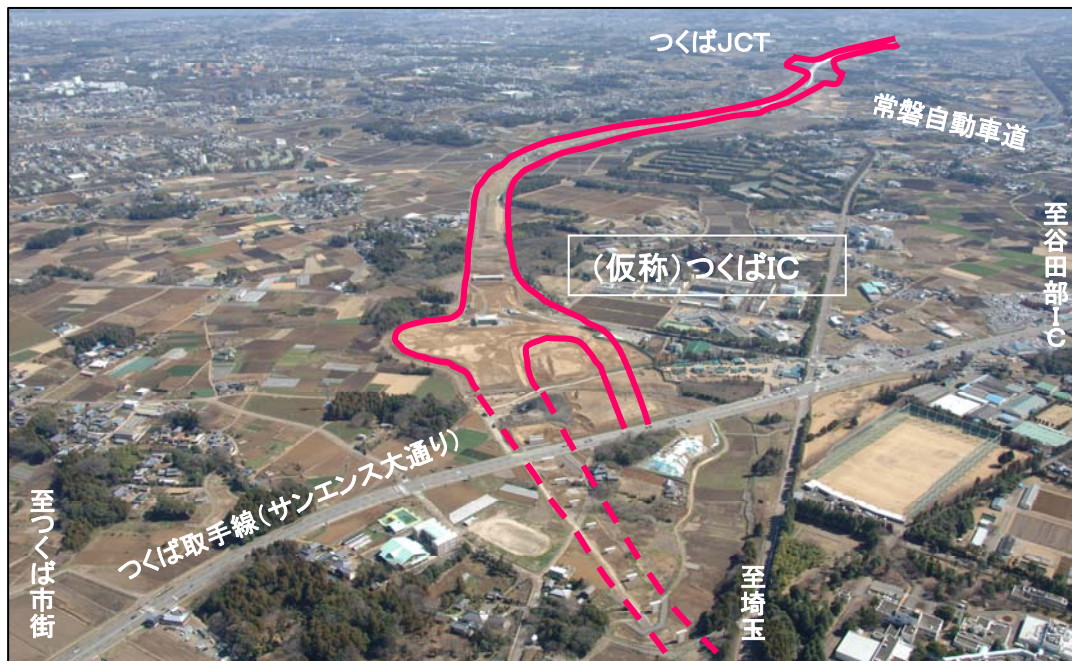
(仮称)つくばIC空撮(つくばJCT方面を望む)