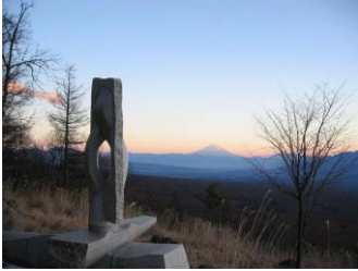
創造の森彫刻公園