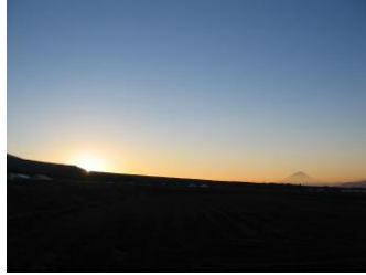
立沢大規模水田地帯