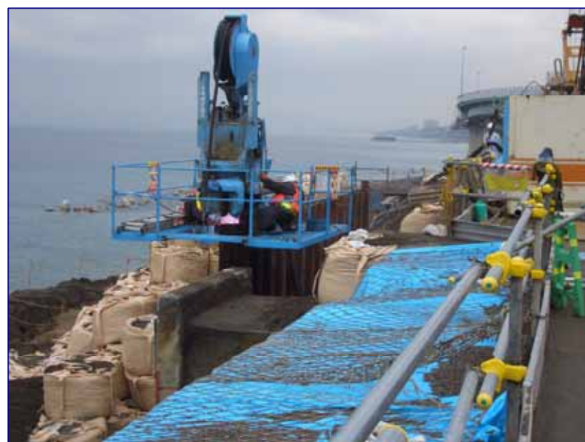
5 K 7 0 0 付近