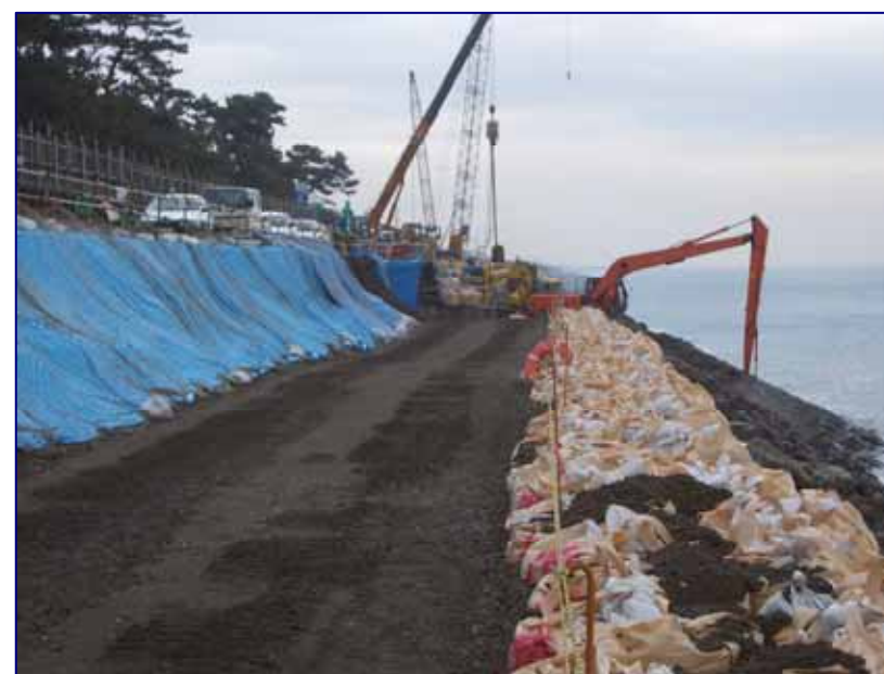
5 K 8 0 0 付近