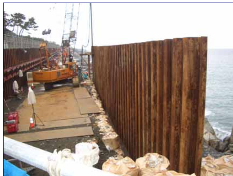
5 K 5 0 0 付近