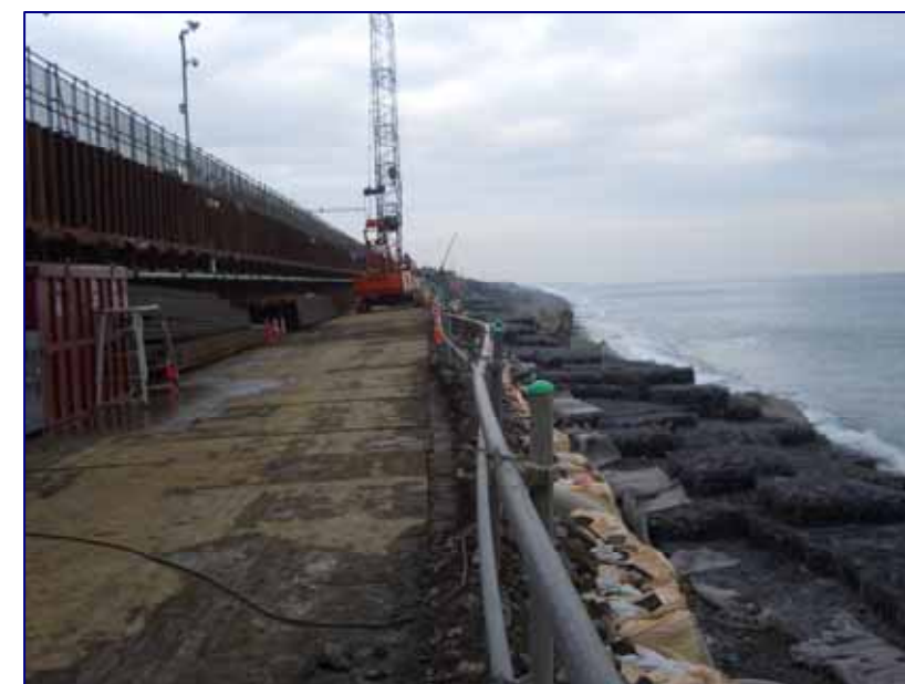
5 K 6 0 0 付近