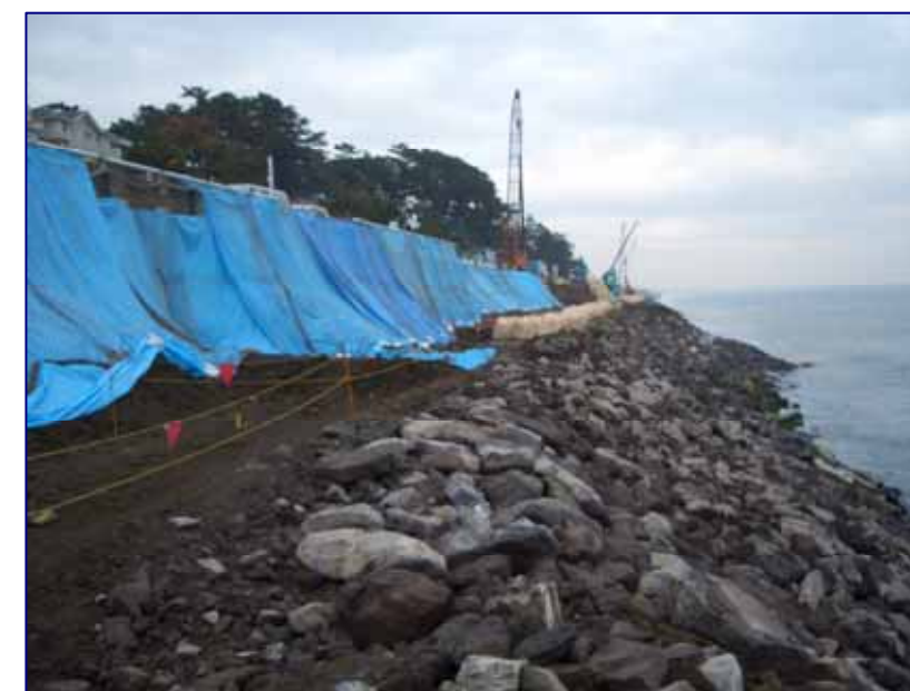
5 K 9 0 0 付近