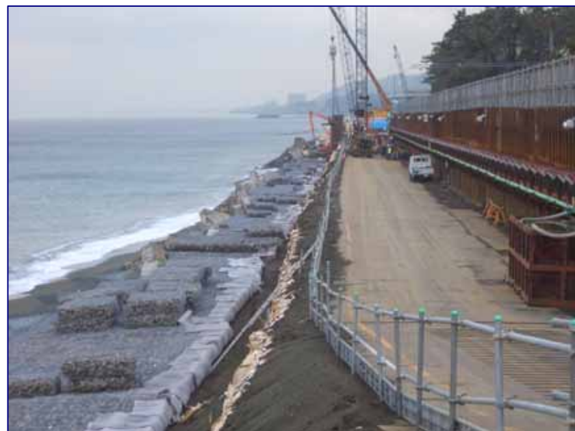
5 K 4 0 0 付近