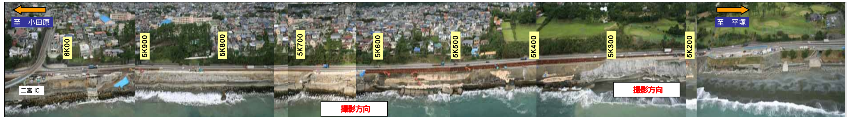
被災区間の航空写真