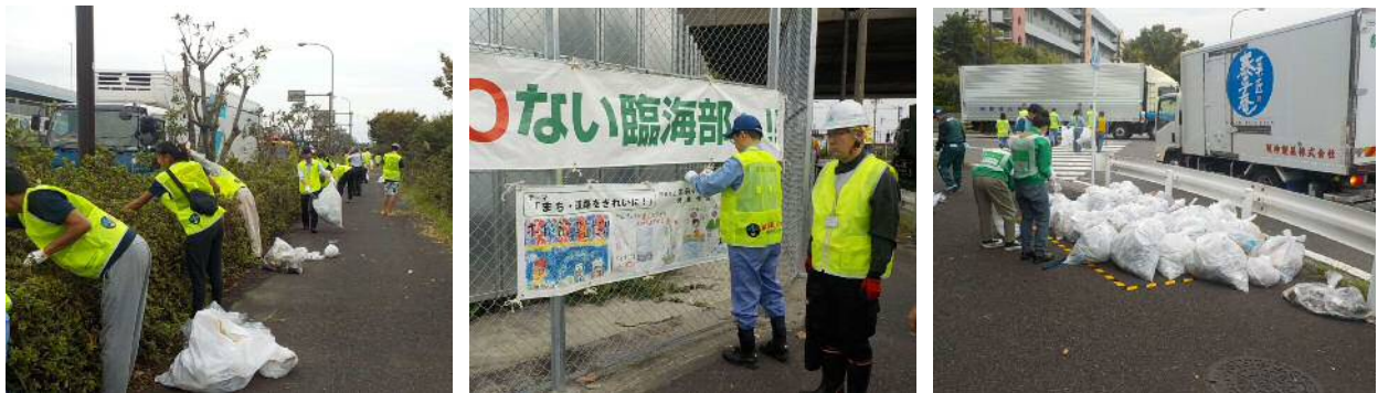
【昨年の活動状況(平成29年9月27日撮影)】

※当日は取材可能です。お越しになる場合は、事前に下記問い合わせ先までご連絡下さい。