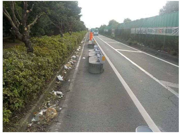
2. ポイ捨てごみの現状