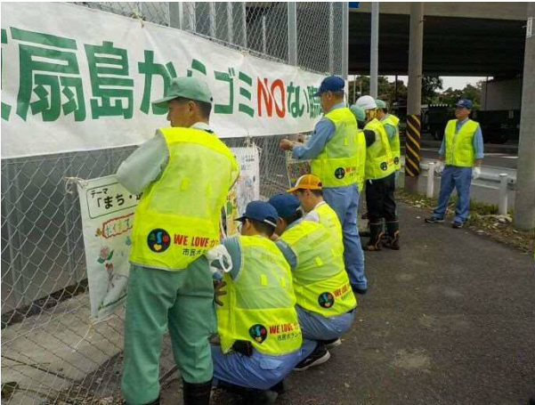
3. 啓発横断幕の設置状況