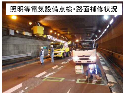
照明等電気設備点検・路面補修状況