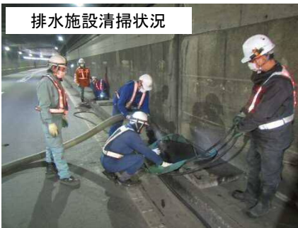
排水施設清掃状況