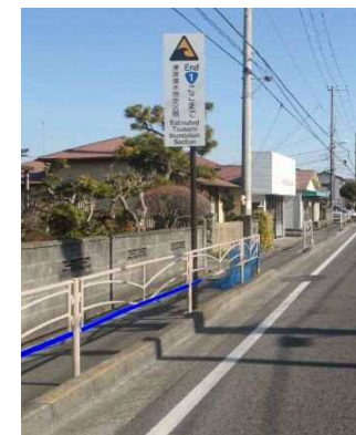
小田原市小八幡 （終点）