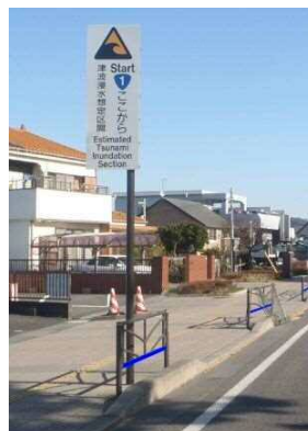
小田原市小八幡 （起点）