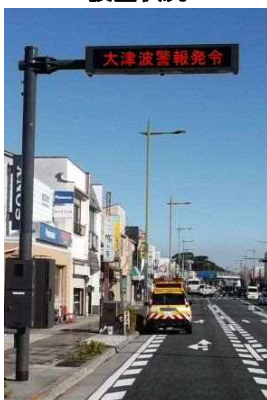
小田原市浜町交差点