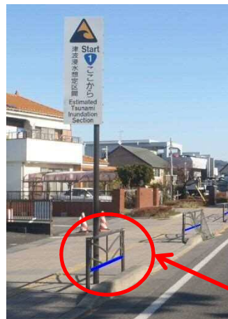
小田原市小八幡（起点）