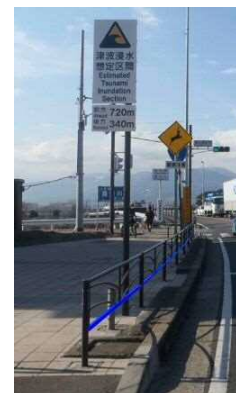
小田原市酒匂 （区間内）