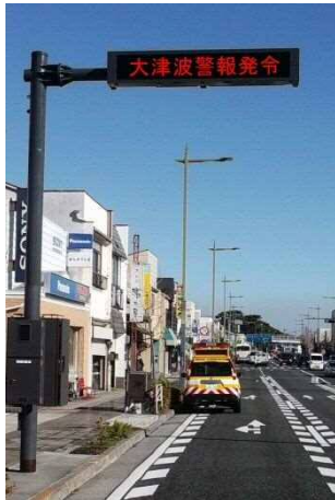
小田原市浜町交差点