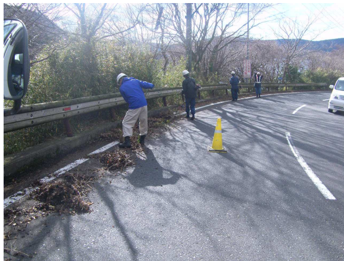
神奈川県建設業協会の清掃状況(箱根地区)