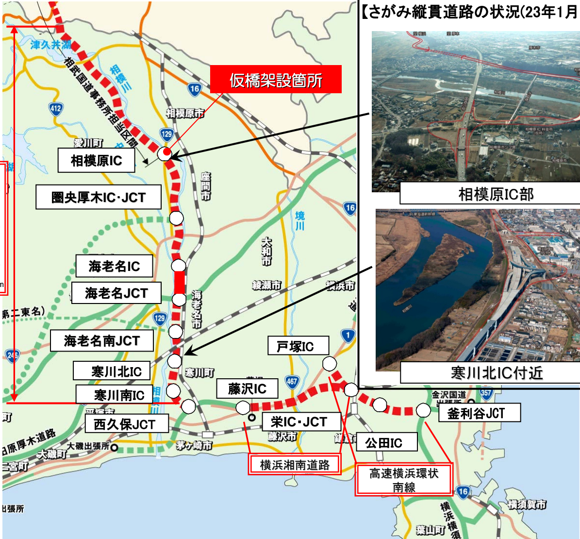
【さがみ縦貫道路の状況(23年1月撮影)】