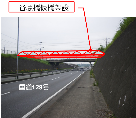
【谷原橋仮橋架設イメージ】