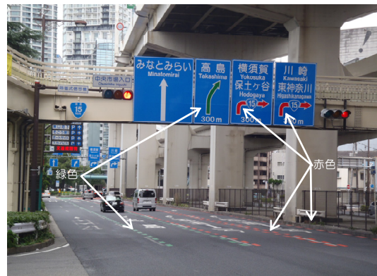
国道15号下り 栄町交差点手前（横浜方面）【対策後】