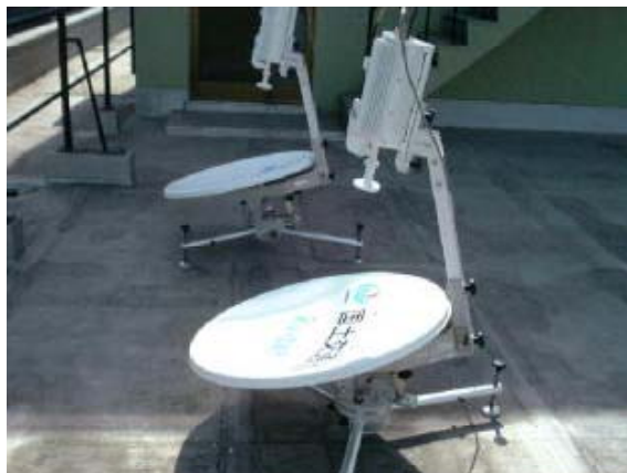
衛星小型画像伝送装置