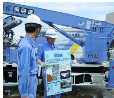
平成21年度実施状況

取材について 当日の訓練は、取材可能です。12：30より訓練会場にて受付を行っております。また、駐車も可能です。