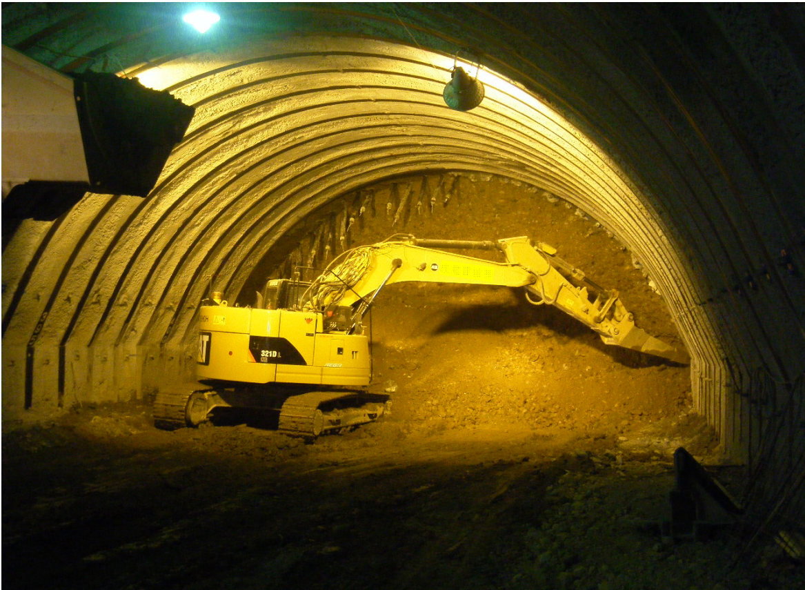
トンネル掘削状況