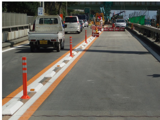
上り線交通状況（西湘二宮IC出口） 21日14時撮影