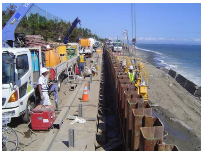
シートパイルと道路の空隙充填作業の状況 21日14時撮影