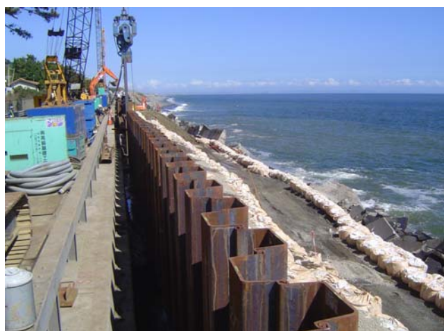
シートパイル打設状況 21日14時撮影