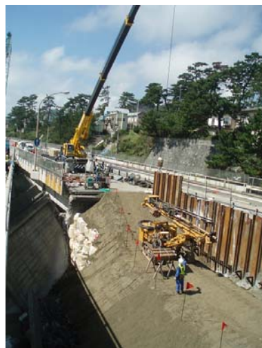
シートパイルアンカー工施工状況 21日14時撮影