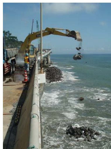
仮設消波堤築堤状況 21日14時撮影