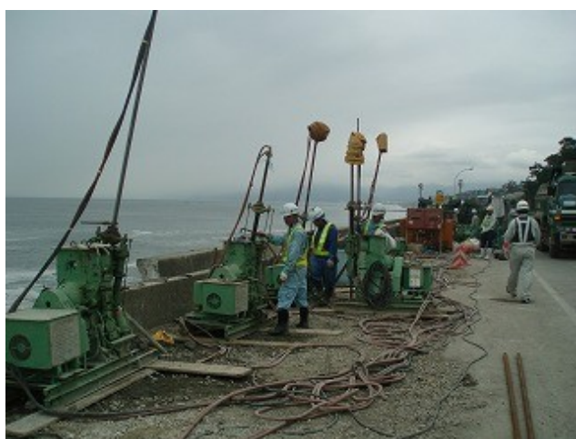
流出防止作業状況 19日14時撮影