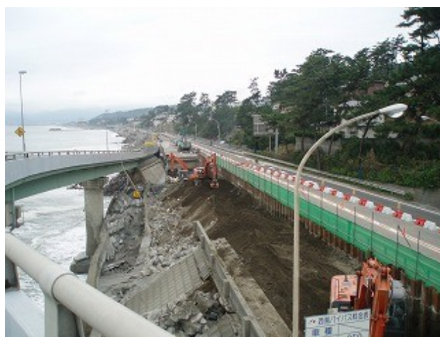
シートパイル前面整地状況 19日14時撮影