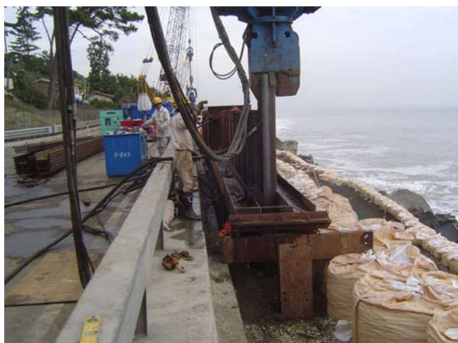
シートパイル打設状況 19日14時撮影