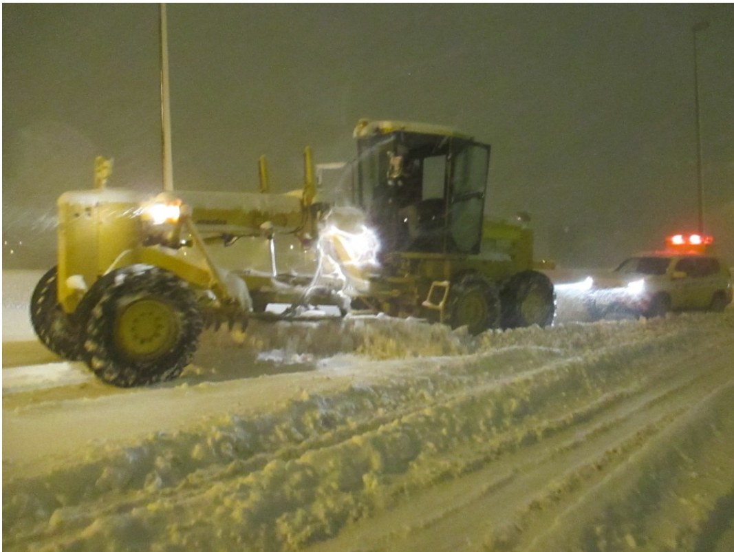
移動状況(国道298号 千葉県市川市高谷ジャンクション)

甲府河川国道事務所（山梨県）に到着後、富士川町～身延町間を2日間不眠不休で国道約10kmの除雪支援に尽力され、交通障害の早期復旧に多大な貢献をされた。