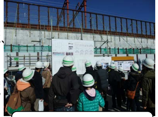
昨年度の見学会の様子 (JR総武線交差部工事の説明)