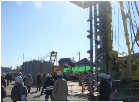
昨年度の見学会の様子 (工事用機械の紹介)