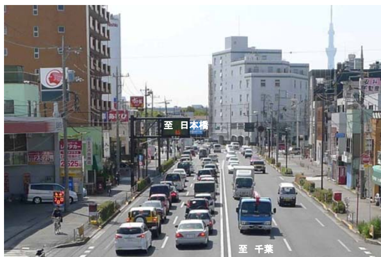
東小松川交差点付近 (平成24年4月撮影)