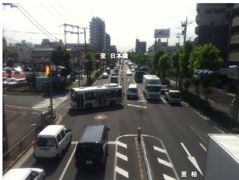
金町1丁目交差点付近 (平成24年9月撮影)