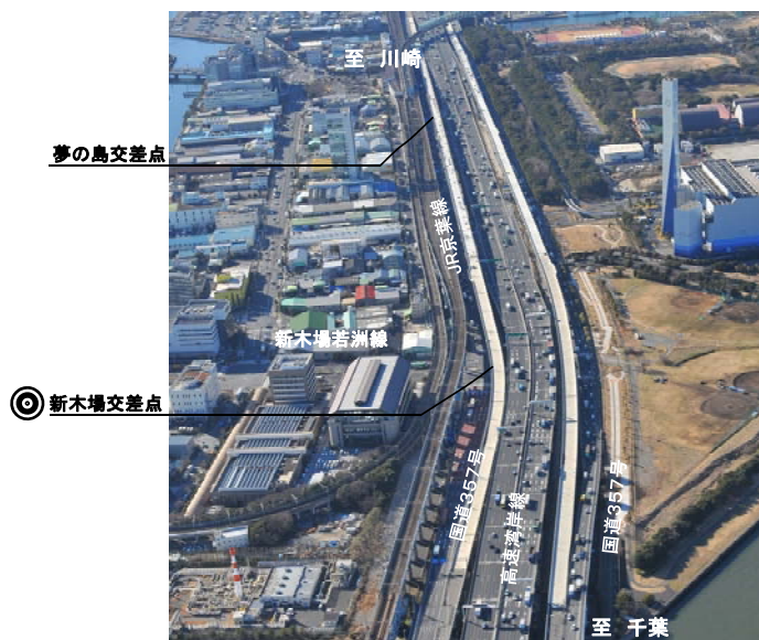
新木場地区 (平成25年2月撮影)