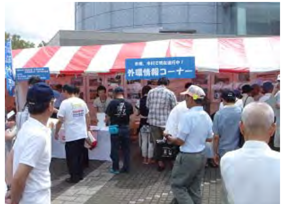
平成23年度 いちかわ産フェスタ 外環情報コーナーの様子