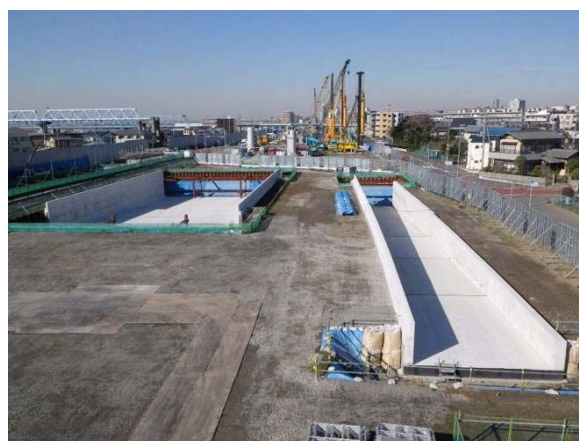
専用部及びAランプ部完成写真