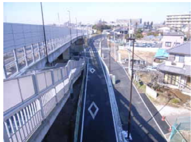
完成時(富士見台歩道橋より起点側を望む)