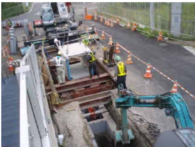
外回り排水(オープンシールド)施工状況

技術者(現場代理人)については、コミュニケーション能力に優れ、沿道住民ひとり一人から信頼された。また、土木技術者として現場で発生した課題に対し臨機な対応で解決し、定められた品質・性能を確保した。さらに、安全管理についても創意工夫し無事故に努めかつ工期内に余裕を持って完成させた有能な技術者である。