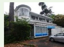
旧滄浪閣 (伊藤邸跡・旧李王家別邸)