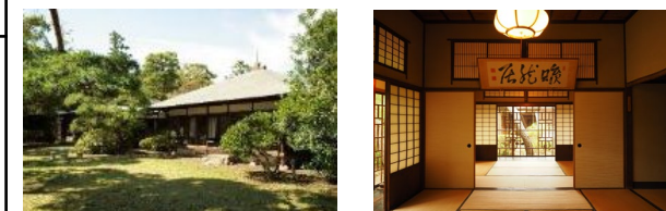
旧大隈別邸・旧古河別邸