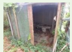
西園寺別邸跡・旧池田邸