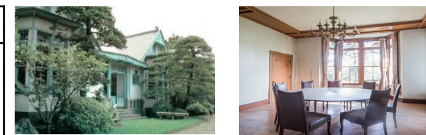
旧滄浪閣（伊藤邸跡・旧李王家別邸）