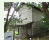
旧大隈別邸・旧古河別邸