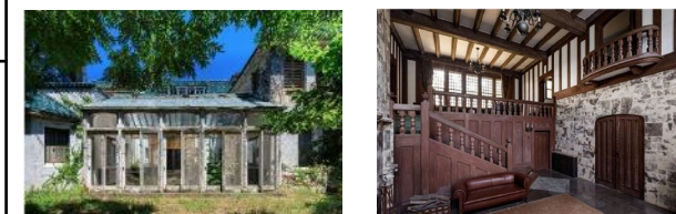
西園寺別邸跡・旧池田邸