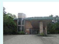
旧滄浪閣(伊藤邸跡・李王家別邸)