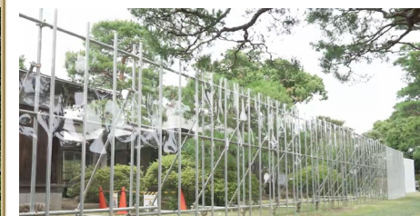
旧大隈邸周辺の様子(6/17) バリケードを一部透明にすることで邸宅工事の様子を見学できるようになっている