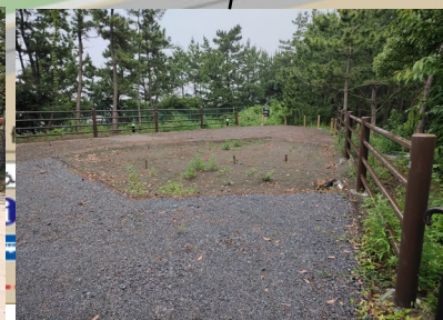
町区域で四阿を整備予定