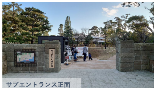
サブエントランス正面