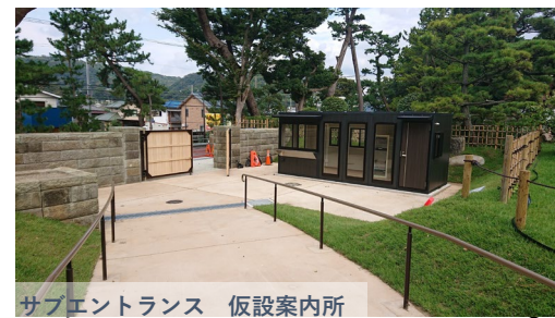
サブエントランス 仮設案内所