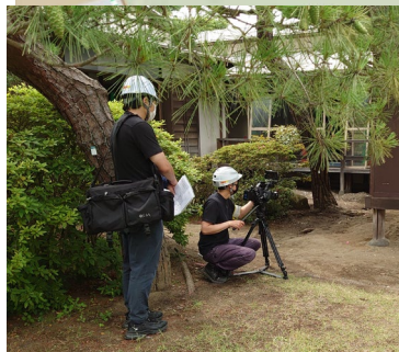
6/17より改修工事の映像記録撮影を開始