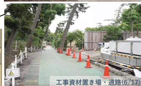
工事資材置き場・通路(6/17)