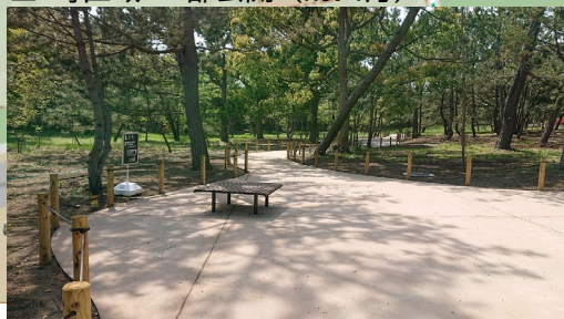
樹林内休憩スペース(町区域)