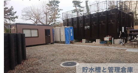
貯水槽と管理倉庫