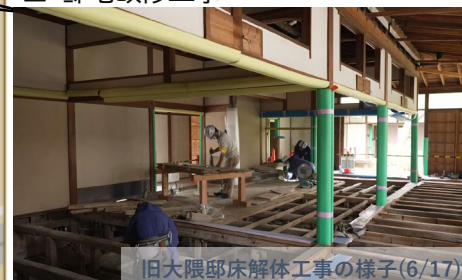
旧大隈邸床解体工事の様子(6/17)