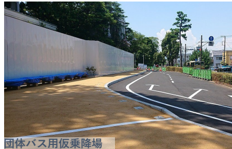
団体バス用仮乗降場