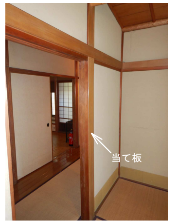
b 当て板が施された桧正角柱