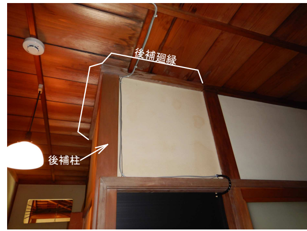
a 間仕切り改造 (後補柱・廻縁)