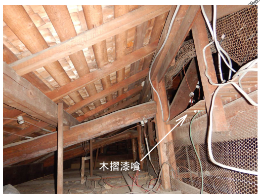
d 小屋に確認される鉄製亀甲網・木摺漆喰