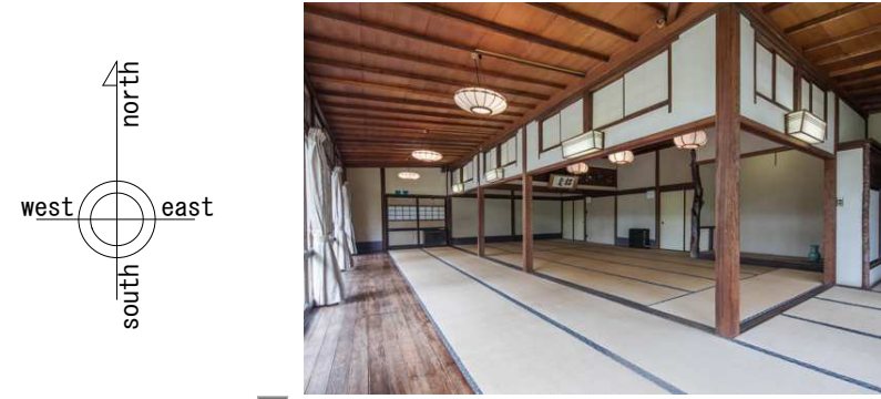
b 松正角柱が使用される和室