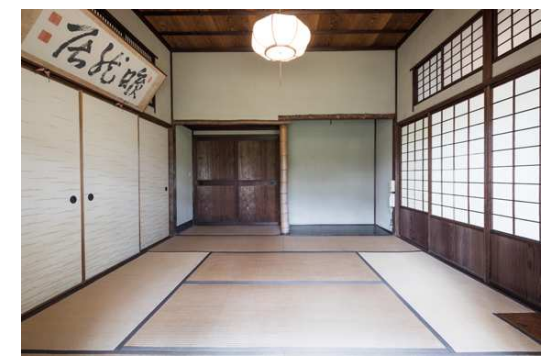
c 松正角柱が使用される和室