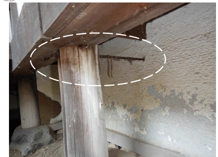
d 床下に柱を繋ぐ鉄筋棒