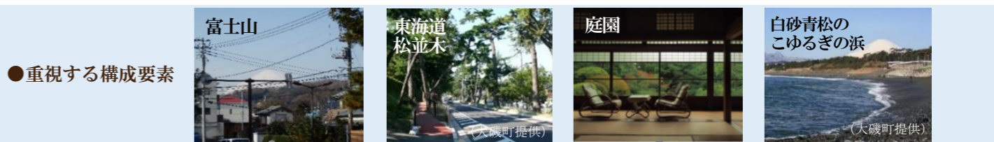
● 重視する構成要素