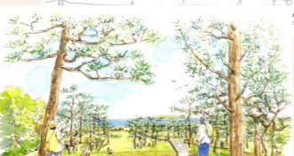
▲ 旧滄浪閣の庭園のイメージ