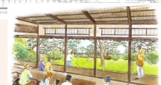
▲ 旧大隈別邸から眺める庭園のイメージ