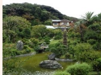
神奈川県立大磯城山公園旧吉田茂邸

また、神奈川県立大磯城山公園旧吉田茂邸等の湘南邸園文化に関する地域の観光資源、相模湾一帯の太平洋岸自転車道等との連携を図るなど、国、神奈川県、大磯町が連携し、広域的な周遊観光ネットワークの形成を目指します。