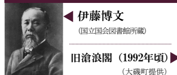
伊藤博文