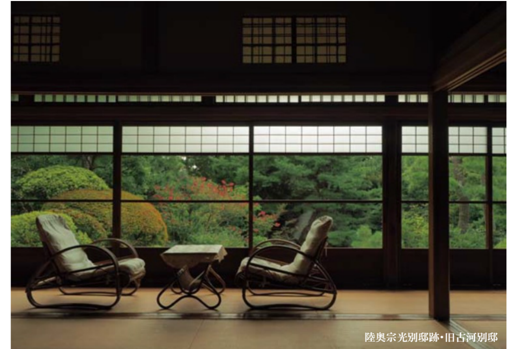
陸奥宗光別邸跡・旧古河別邸