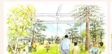
▲ 憩い・交流の空間イメージ