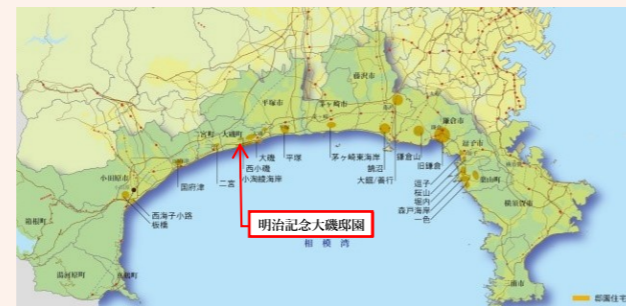
邸園分布図

しょうなん ※「湘南」という呼称の発祥には、諸説があり、その一つとして、大磯町に俳諧道場として建てられた鳴立庵にある標石に由来するといわれています。「湘南」の呼称は、保養地・別荘地の発展とともに相模湾沿岸地域一帯で使用されるようになりました。