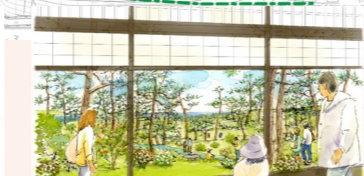
▲ 陸奥別邸跡から眺める庭園のイメージ