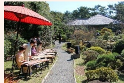
邸園を活かした文化活動の例 (神奈川県葉山町葉山しおさい公園)

また、風致の保全に向けて、地域活動団体等との協働による松林の保全・再生に取り組むとともに、民間活力の導入等による憩いと交流の拠点としての機能の充実を目指します。