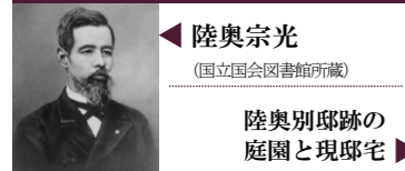
陸奥宗光