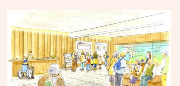
▲ エントランス・ガイダンス空間のイメージ

邸宅及び庭園の立地、積層する歴史、現状等の特徴を踏まえ、各空間の中心的な役割を担う邸宅の区域を設定し、これら区域が重なり合いながら、各邸宅等が相互に連携する空間構成とします。