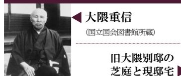
大隈重信