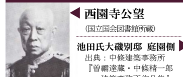
西園寺公望