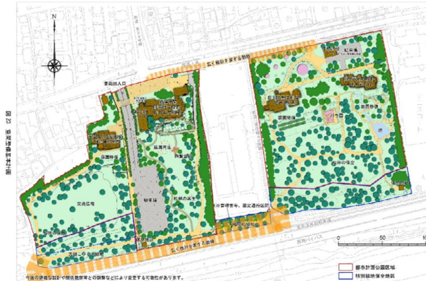
図23.空間整備基本計画