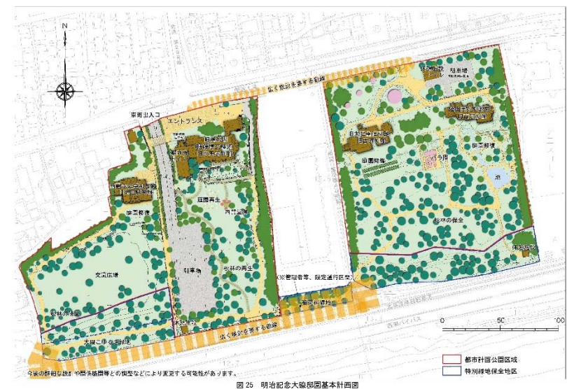
図25.明治記念大磯邸園基本計画