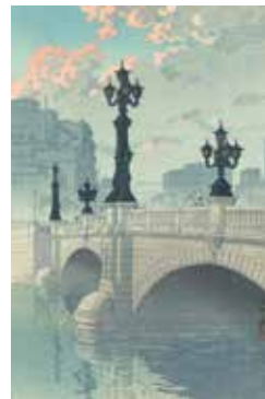
川瀬巴水 東海道風景選集 日本橋（夜明） 昭和15年作