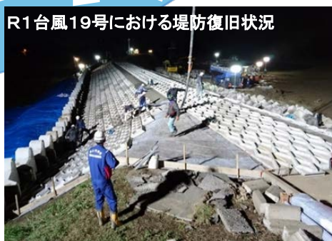
R1台風19号における堤防復旧状況