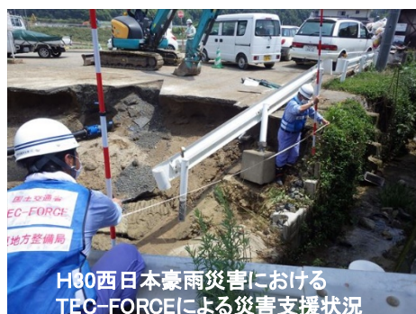
H100西日本豪雨災害における TEC-FORCEによる災害支援状況