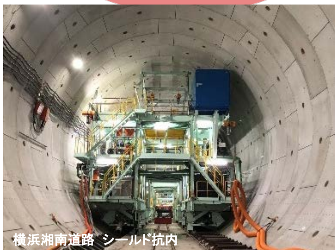
横浜湘南道路 シールド抗内