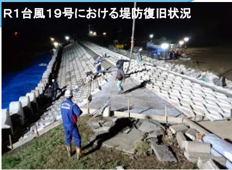
R1台風19号における堤防復旧状況