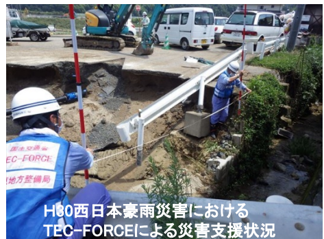
H30西日本豪雨災害における TEC-FORCEによる災害支援状況