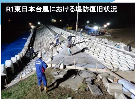
R1東日本台風における堤防復旧状況