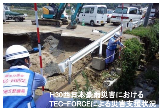
H30西日本豪雨災害における TEC-FORCEによる災害支援状況