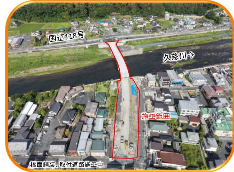
⑮ 大子町 大子地区(松沼橋)