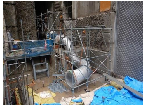
【放流設備工(コンクリート工)】 （撮影日：R8.6.11）