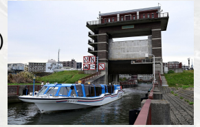
荒川ロックゲート