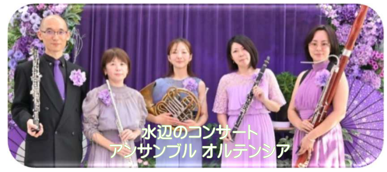
水辺のコンサート アンサンブル オルテンシア