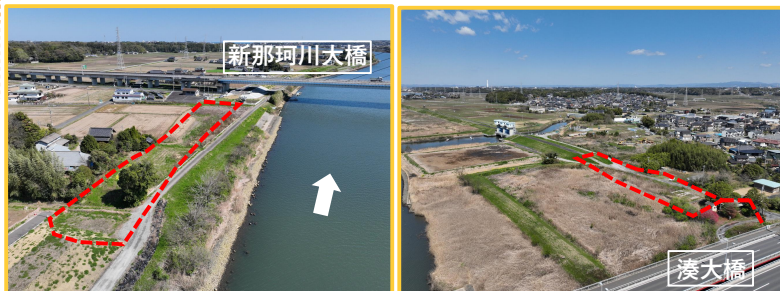
工事箇所の全景 (4.2k 付近) (三反田付近)