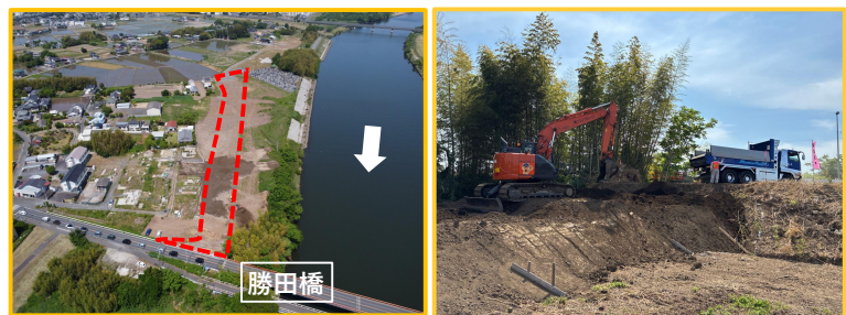
工事箇所の全景 (下流から)