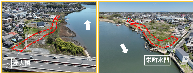
工事箇所の全景 (上流から)