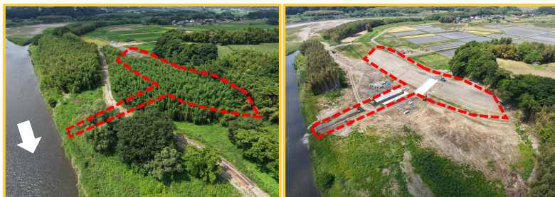
工事箇所の全景 (下流から・施工前)