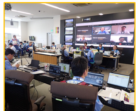
自治体とのホットライン訓練