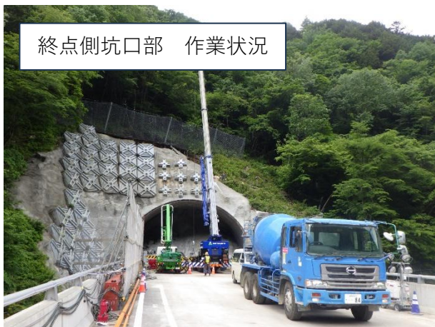
終点側坑口部 作業状況