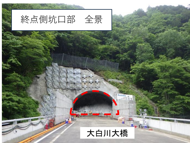
終点側坑口部 全景