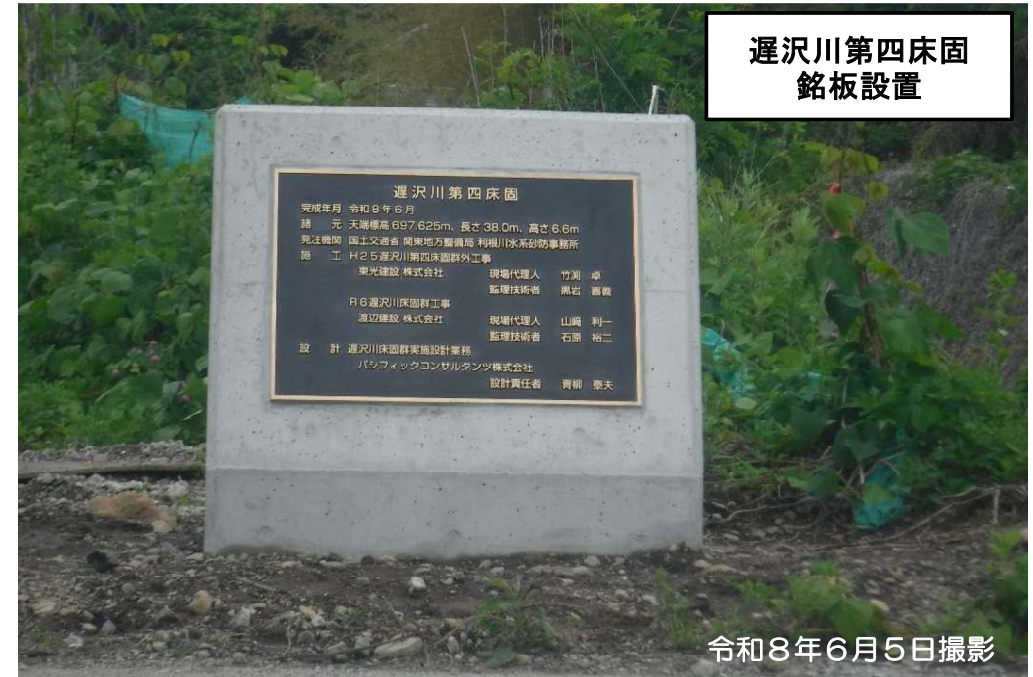
遅沢川第四床固 銘板設置