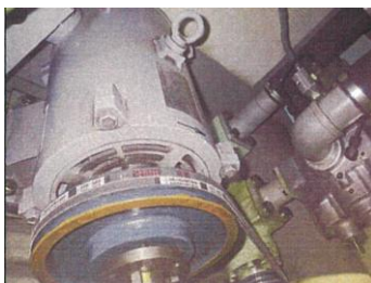
②既存エレベーター機械室 パワーユニット