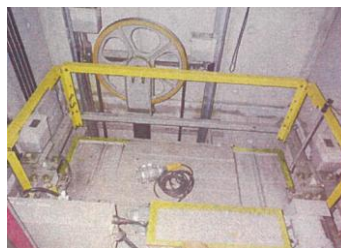
既存エレベーターシャフト内2