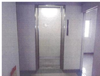
エレベーター正面