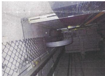
既存エレベーターシャフト内3