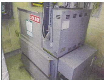
①既存油圧エレベーター機械室