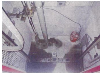
既存エレベーターシャフト内1