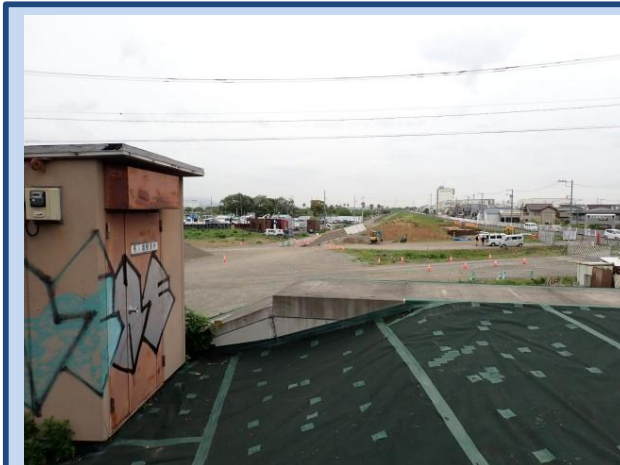
堤防を整備しています。 (令和8年4月)