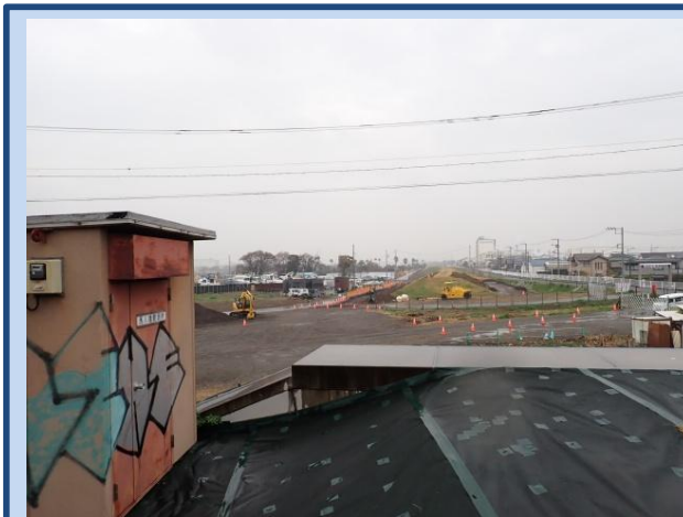
堤防を整備しています。 (令和8年3月)