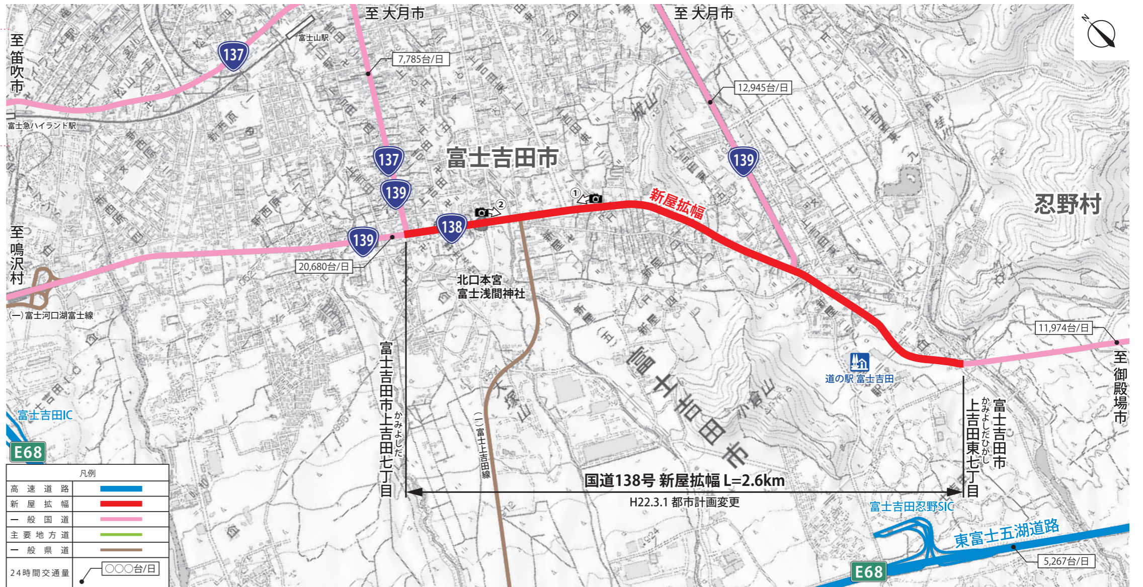
この地図は国土地理院長の承認を得て、同院発行の2万5千分の1地形図を使用し作成しました。