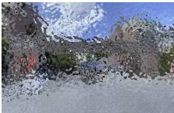
写真-1 中国の住宅（注：個人情報保護のためぼかし加工を施している）

中国の住宅は、写真のように住宅の周囲が塀で囲われており、敷地内に入るには看守のいるゲートを通る必要があるため、止められると地権者自宅（玄関）までたどり着けない可能性があったため、これらの確認もまた、事前訪問の目的であった。