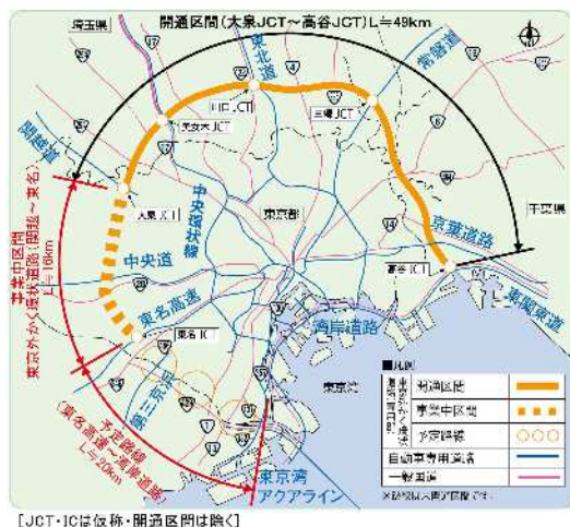
図-1 外環事業の概要図

東京外かく環状道路（関越～東名）（以下「本事業」という）は、都心から約15kmの圏域を環状に連絡する道路であり、首都圏の渋滞緩和、環境改善や円滑な交通ネットワークを実現する上で重要な道路である。住宅等が密集する市街地を通過する道路のため、地上への影響を軽減することを目的とし、大部分をトンネル構造にて事業を進めている。本事業は2014年に事業地の大部分が大深度地下を通る構造として大深度地下使用の認可並びに都市計画事業承認及び認可された。