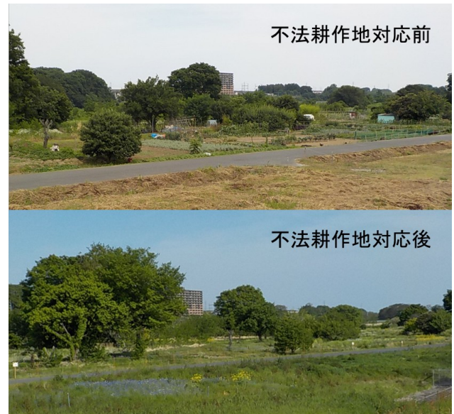
図-8 不法耕作地対応前後の様子

あるとよいことである。不法係留船については廃棄してよいか判定するチェックリストが存在し、ある程度誰もが同一の判定ができるようになっている。ところが、不法耕作地の物件には明確な基準がない。今回の不法耕作地対応では有機能の物件を廃棄物としたが、有機能の物件は簡易代執行対象物件とするべきとの意見もあった。不法耕作地には多種多様な工作物があり、個別の判定が必要ではあるが、少なくとも同種の対象物において、担当者の判断のばらつきが抑制できるような基準の存在が必要であると考えられる。