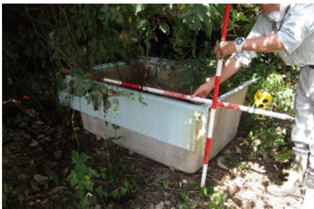
図5 廃棄物と判定した放置工作物