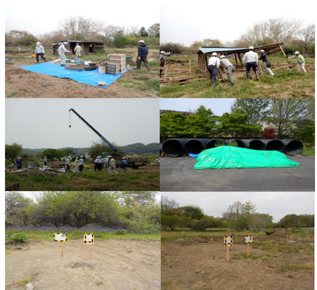
図7 簡易代執行実施状況