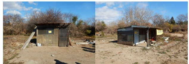
図6 簡易代執行対象物件

簡易代執行で撤去した物件については、河川法第75条第5項に基づき、返還の公示を行った。官報への掲載および現地に看板を設置したが、六ヶ月間所有者が現れなかったため、所有権は国に帰属し、保管している農具小屋の資材と農機具は廃棄処分を行うこととなった。