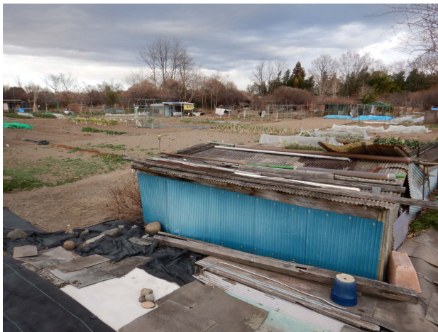
図-1 不法占用の状況

不法耕作への対応を検討していたところ、当該地を近隣で実施している築堤事業に用いる土を採取する場所として活用することとなった。これに伴い、河川工事のスケジュールに支障が生じないように、2025年当初までに一帯の不法耕作を是正することとした。