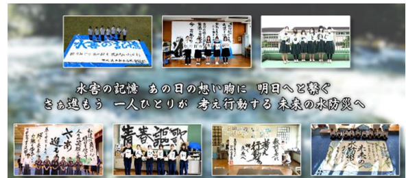
図-5 書道部メッセージムービー

各作品には、先生と生徒が考えた、記憶を未来へ繋ぐためのメッセージも加えられるなど、高校生の水害に対する思いが伝わる感動的な作品ができた。(図-5)