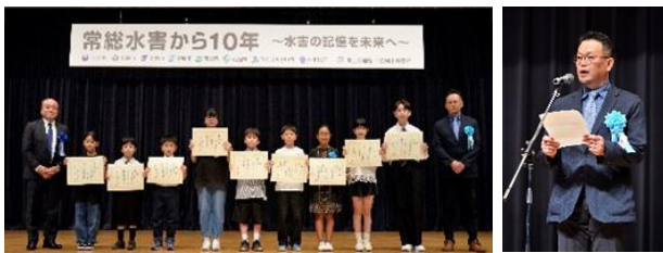
図-6 表彰式と講評の様子

子供たちへ、人と川との関りについて興味を持つきっかけにもなったと考える。(図-6)