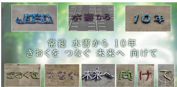
図-7 人文字メッセージムービー

各学校においては、子供達が10年前の水害を知り、命を守るための防災について考える機会となった。