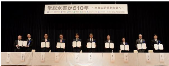
図-2 行動宣言を掲げて(実行委員会メンバー)

次に、今後の方針として、水害の記憶を未来へ繋げ、逃げ遅れゼロを目指し、水害リスクのジブンゴト化や共助による地域防災力の向上、流域治水の推進など5項目の取り組みを推進することを「行動宣言」としてまとめ、これを実行委員長が力強く宣言し、行政としての新たな決意や意気込みを関係者はもとより住民へも伝えた。(図-2)