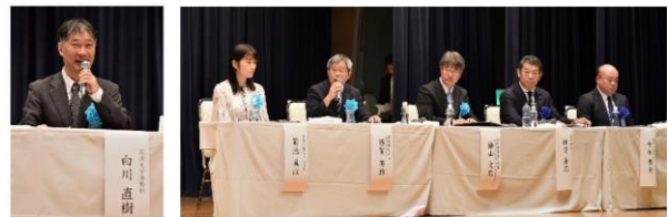
図-4 パネルディスカッションの様子

パネリストそれぞれの経験や立場からのコメントは、とても説得力があり、住民の「自助・共助」の意識向上につながるディスカッションとなった。(図-4)