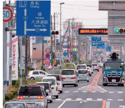
▲大津地区の交通状況(大津港駅入口交差点付近)