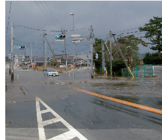
▲東日本大震災時の津波浸水状況(御城前交差点付近)