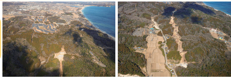
① いわき市側( R5.3撮影 ) ② 北茨城市側( R5.3撮影 )