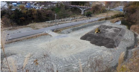
写真-6 受入先での盛土状況