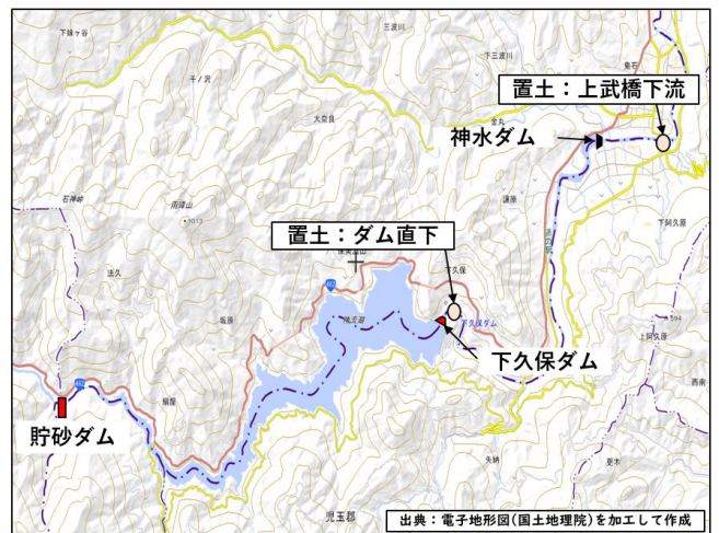
図-2 河川内置土 位置図

下久保ダムでは、堆砂土の有効活用の取組として、近傍の砂利採取業者による土砂採取の受け入れや、近傍での公共工事への活用、また、 図-2 に示す箇所に下流河川の環境保全を目的とした土砂還元への活用等を図ってきたところである。しかし、近年では近傍の砂利採取業者が廃業となったこと、出水が少なくダムからの放流が少なかったため、下流河川の置土が還元されず、さらなる置土が出来ない状況となっており、計画的な堆砂土の有効活用が課題となっていた。