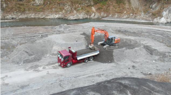
写真-5 貯砂ダム上流での堆砂土掘削状況