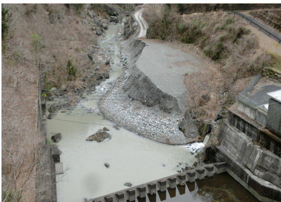
写真-2 河川内置土（ダム直下）

また、相手側への堆砂土引き渡し必要な堆砂土の受入場所について、ダム管理者にて確保する場合は、借地費用と管理費用が必要となるが、公募により堆砂土の有効活用を希望する者（堆砂土引取希望者）が堆砂土の受入地を確保することで、借地と土地の適切な管理に要するダム管理者の負担を軽減することとした。