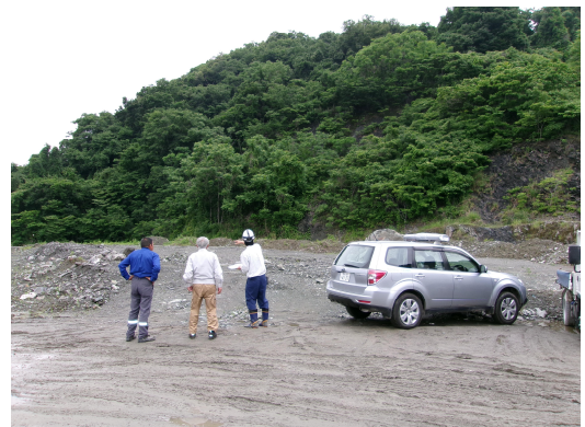
写真-4 堆砂土受入先の現地確認状況

審査の結果、堆砂土の有効活用に必要な資格や能力を有し、かつ、確保用地も問題ないことから、応募があった1者を堆砂土引取業者として特定した。