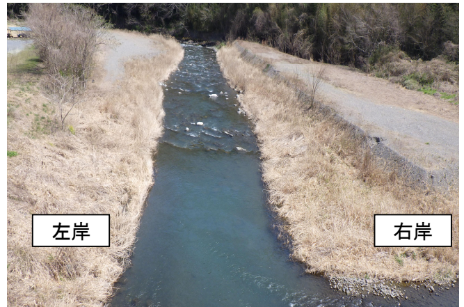
写真-3 河川内置土（上武橋下流）