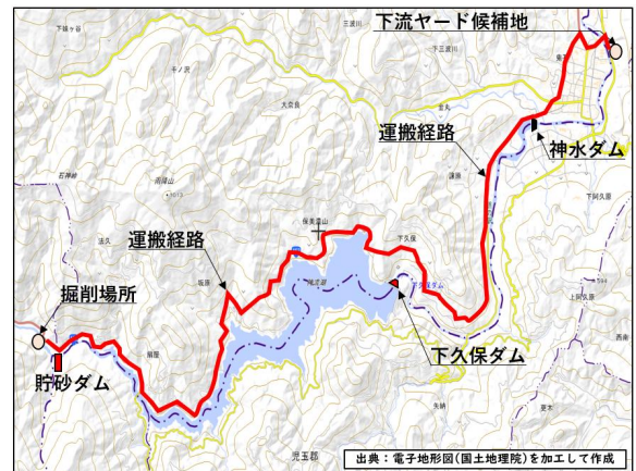
図-3 ダム下流ヤード候補地 位置図