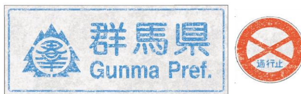
図-3 新標識デザイン

ダメージ加工標識の製作にあたっては、旧標識の持つ雰囲気再現することを目的に、標識メーカー等とともに製作方法を検討した。新品標識に傷や剥離跡を物理的に付与する方法も検討したが、耐久性の観点から採用には至らなかった。最終的に、旧標識に見られた「かすれ」や「変色」などをグラフィックデザインで表現する方法を採用し、従来の風合いを残した標識を製作した(図-3)。