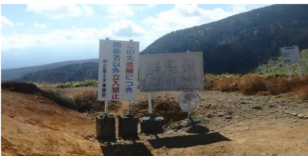
図-1 毛無峠県境標識

本稿は、県境標識および通行止め標識の更新に関し、更新方法の比較検討から施工、事後の反響把握までの一連の取組について報告する。