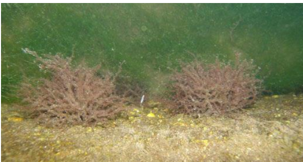
写真-1 カワモツク確認個体 (2024.5.15撮影)

カワモツクは、2023年に改訂された東京都レッドデータブックには絶滅の危険が増大している「絶滅危惧II類」として掲載されていたが 2) 、2025年3月公表の環境省の第5次レッドリストでは、重要種、保全対象種の見直しがされており、存続基盤が脆弱な「準絶滅危惧」へとランクが引き下げられている 3) 。依然として重要種からは外れていないため、引き続き保全措置を取ることとしている。