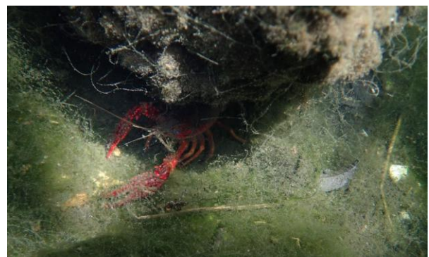
写真-2 アメリカザリガニ (2024.4.17撮影)

アメリカザリガニはカワモツクの捕食者の可能性があり、また攪乱により剥離を起こすためカワモツクに悪影響を与える可能性がある。したがって、定期調査時に籠網と餌を使用して、駆除を行った。（写真-2）