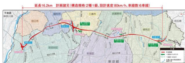
図-1 東京外環道のルート概要

東京外環道は、練馬区、杉並区、武蔵野市、三鷹市、調布市、狛江市、世田谷区の住宅等が密集する市街地を通過する道路であることから、地上への影響を軽減することを目的として、大深度地下方式にて事業を進めている。ジャンクションは大泉JCT、中央JCT(仮称)、東名JCT(仮称)の3つが計画されている。(図-1)