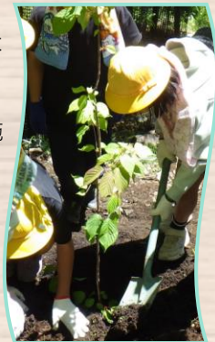
国土交通省 体験植樹