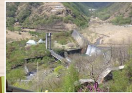
すれ違う方々に励まされ 景色を堪能しながら400段 たくさん休憩して、あと半分！