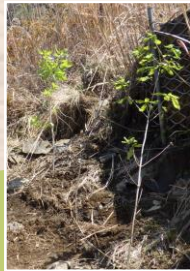
現地に用意されている スコップで穴を掘り 苗木を植えれば植樹完了