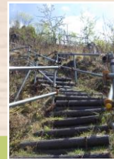
見上げた階段に・・・ 苗木をもって出発！