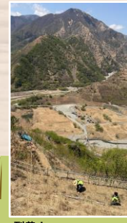
到着！ 900段の階段を 登り切りました！ 途中、声を掛けて くれた方々に感謝