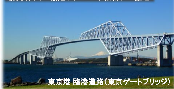
東京港 臨港道路(東京ゲートブリッジ)