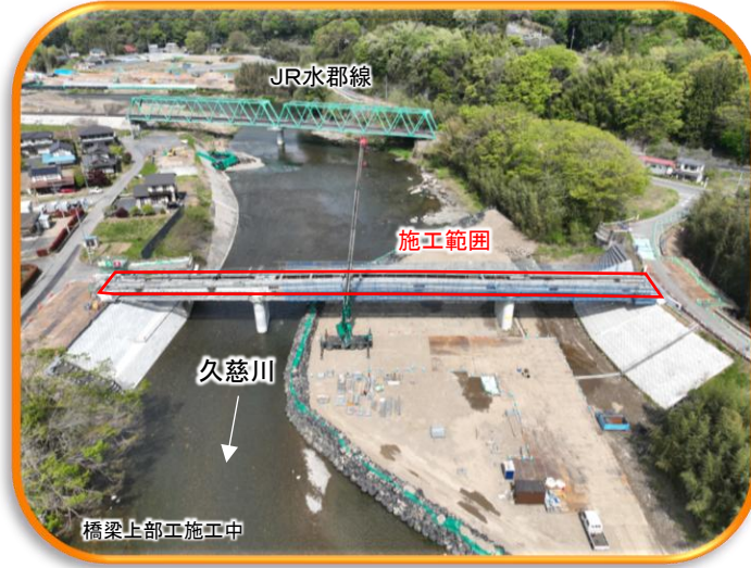
⑫ 大子町 南田気地区(南田気橋)