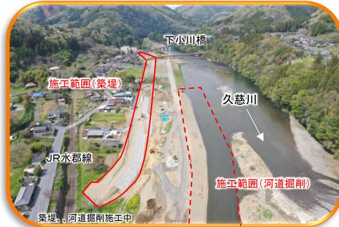
⑦ 常陸大宮市 盛金地区